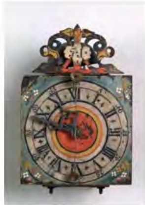
DA MENSOLA Londra