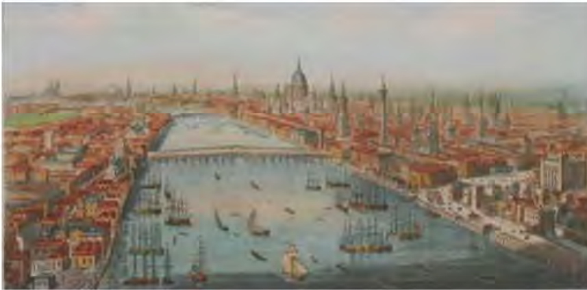
LONDRA SECOLO 18