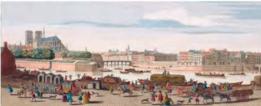
PARIGI SECOLO 18