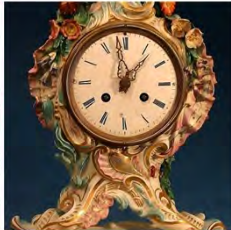
DA MENSOLA porcellana Meissen