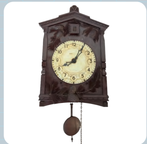
Orologio da Parete Goriški muzej Kromberk - Nova Gorica