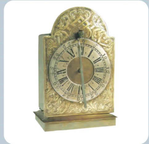
Orologio Zappler Palazzo Fondazione collezioni Coronini Cronberg - Gorizia