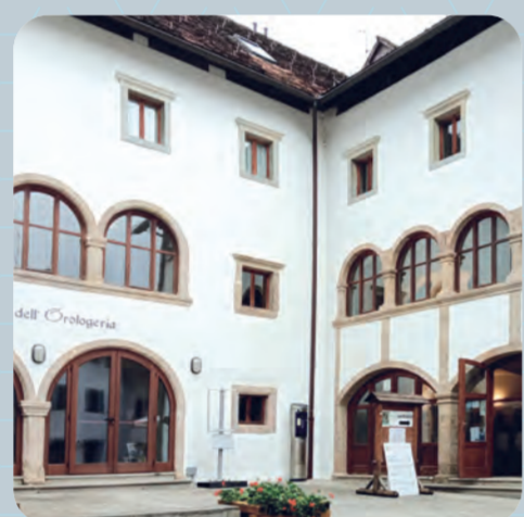
Museo dell'Orologeria - Pesariis

L'arte orologiaia patrimonio culturale del FVG