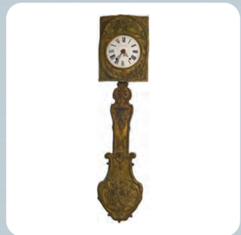
Pendola Comtoise Museo Carnico delle Arti Popolari "Michele Gortani" - Tolmezzo